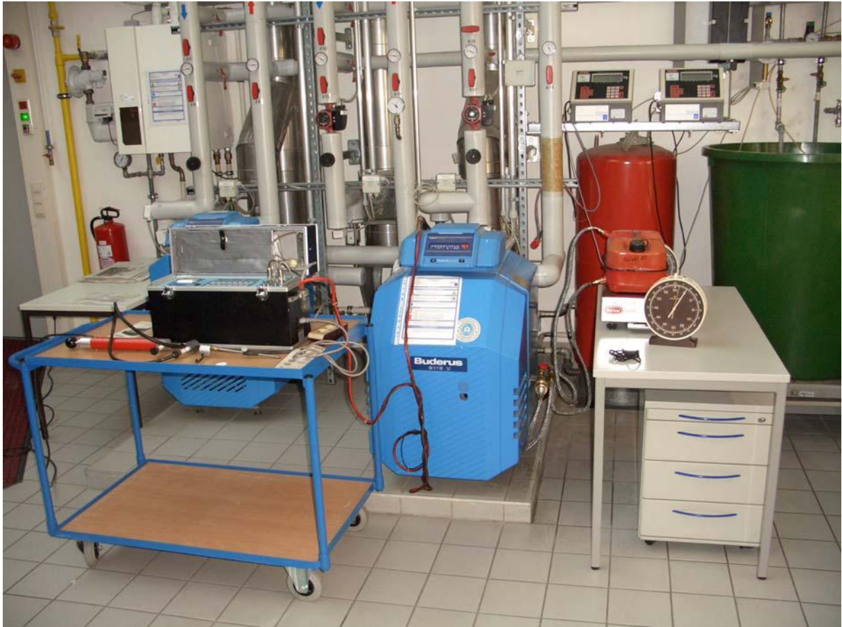
Abbildung 3: Versuchsaufbau HTKC

Der Einbau des HTKC erfolgt nach Herstellerangaben unmittelbar nach dem Ölfilter.