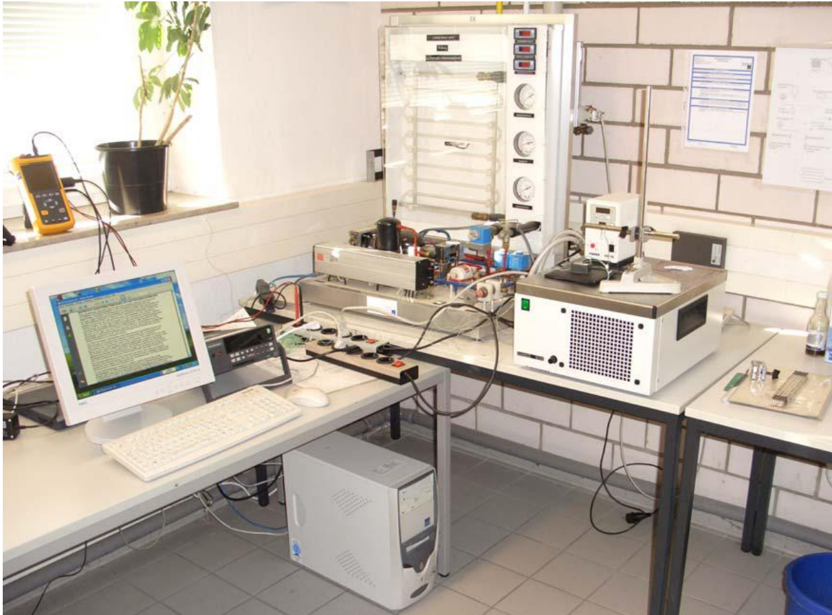
Abbildung 1: Versuchsaufbau RedOx-it therm

Die Erwärmung wurde zunächst nur mit reinem Wasser durchgeführt. Im Anschluss daran erfolgten Versuche mit einer Beimischung von 0,5% bzw. 1,0% RedOx-it therm. Das Additiv wird nach Anweisung vor der Zugabe kräftig geschüttelt.