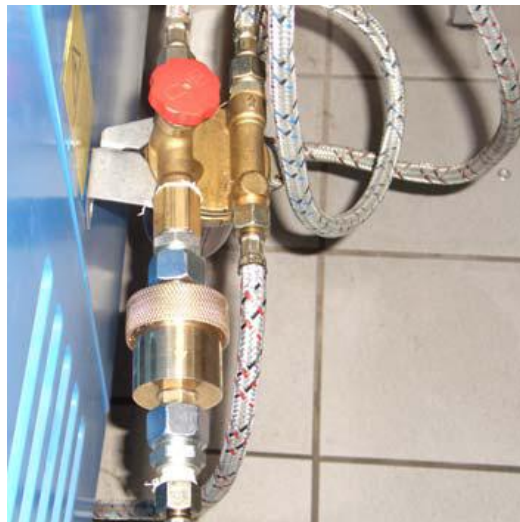
Abbildung 4: eingebauter HTKC – Hochtemperaturkeramikchip

Der Einbau des HTKC erfolgt nach Herstellerangaben unmittelbar nach dem Ölfilter.